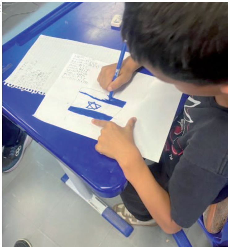
O aplicativo permitiu um contato introdutório, lúdico e interativo com o alfabeto e palavras básicas da língua hebraica, estendendo-se também para o ambiente doméstico sob a supervisão das famílias

"Contamos com o apoio do Consulado Geral do Esta-