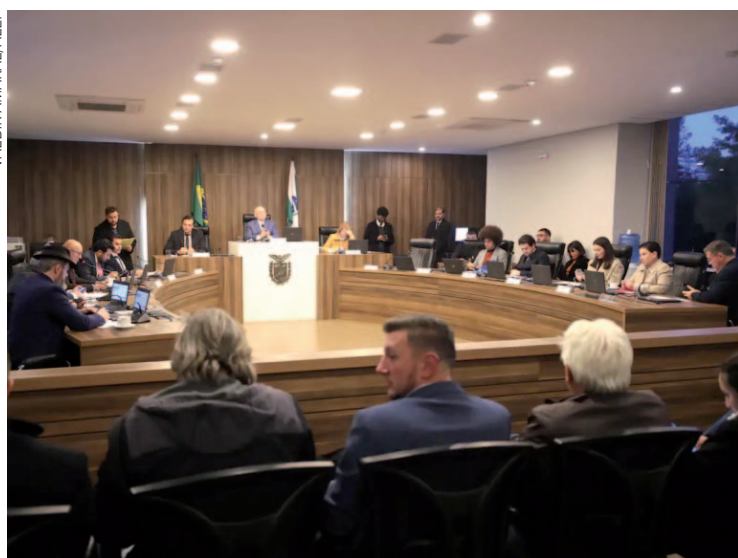
Reunião ocorreu após as sessões plenárias desta segunda-feira (15)

Ainda do Poder Executivo, o Projeto de Lei 500/2026, que altera a Lei nº 11.741/1997 e autoriza o Governo a