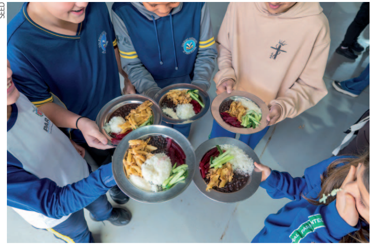
O valor integra os cerca de R$ 500 milhões previstos para a alimentação escolar ao longo de 2026, incluindo alimentos secos e perecíveis

Com esta terceira etapa, as remessas centralizadas feitas em 2026 já somam mais de 10 milhões de quilos de gêneros alimentícios distribuídos às escolas estaduais, totalizando investimento superior a R$ 103 milhões. Os gêneros alimentícios serão utili-