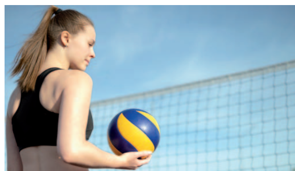
As equipes interessadas devem garantir a inscrição antecipadamente, já que as vagas são restritas