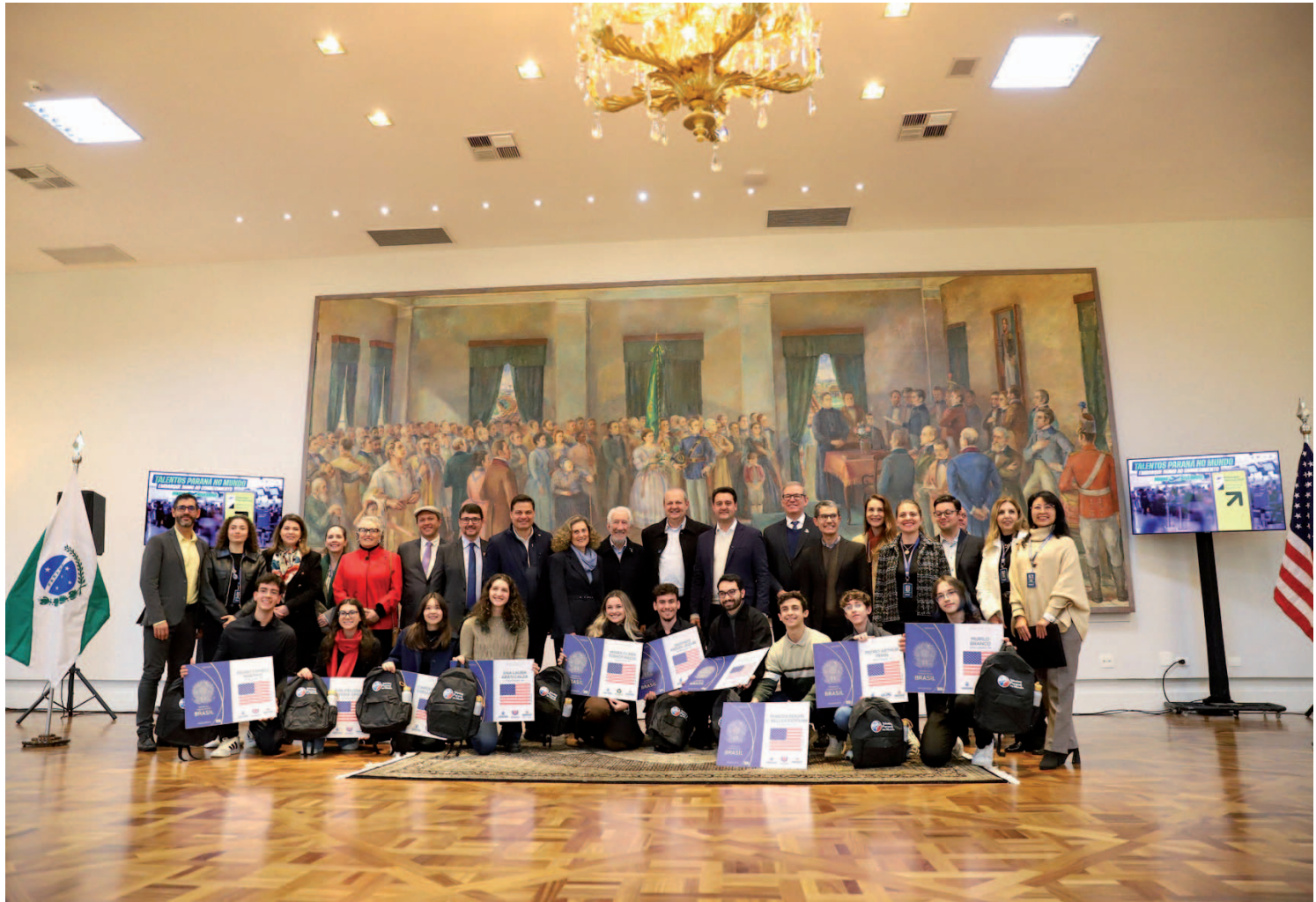
Eles vão estudar na Universidade da Cidade de Nova York (CUNY), instituição que possui entre os ex-alunos e pesquisadores 13 laureados com o Prêmio Nobel