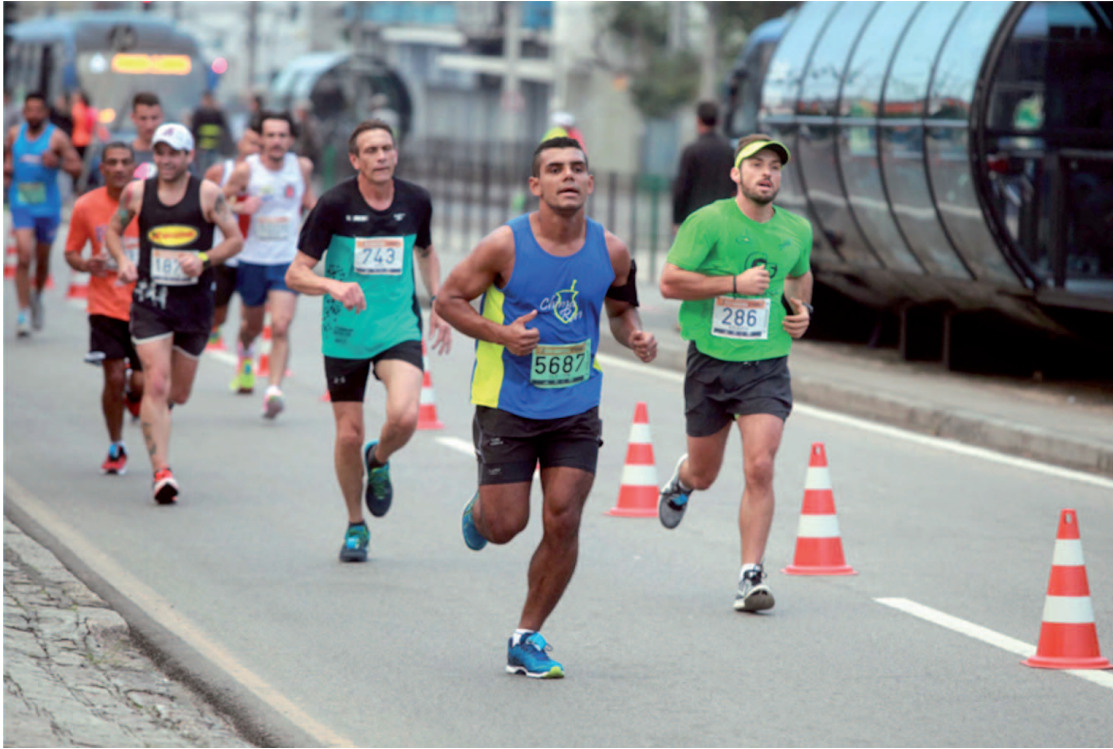
Os interessados poderão se inscrever para competir de forma individual, em duplas ou quartetos