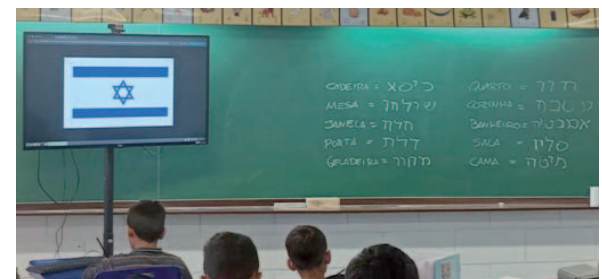
O aplicativo permitiu um contato introdutório, lúdico e interativo com o alfabeto e palavras básicas da língua hebraica, estendendo-se também para o ambiente doméstico sob a supervisão das famílias