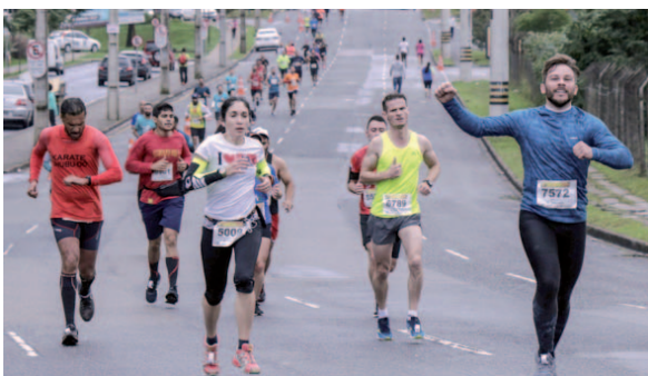
Os interessados poderão se inscrever para competir de forma individual, em duplas ou quartetos