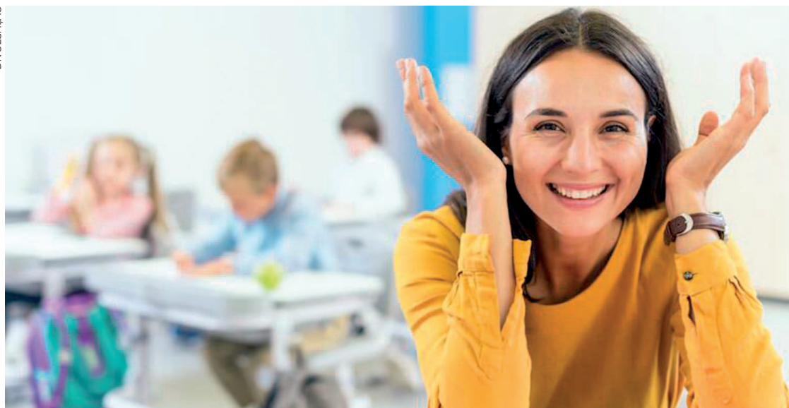
A medida entra em vigor na data de sua publicação e prevê a fruição do período de descanso entre os dias 13 e 22 de julho de 2026

Conforme o decreto, as férias coletivas abrangem os Profissionais do Magistério, incluindo Professores de Educação Infantil, Professores do Ensino Fundamental e Coordenadores Pedagógicos, tanto efetivos quanto contratados por meio de Processo Seletivo Simplificado (PSS),