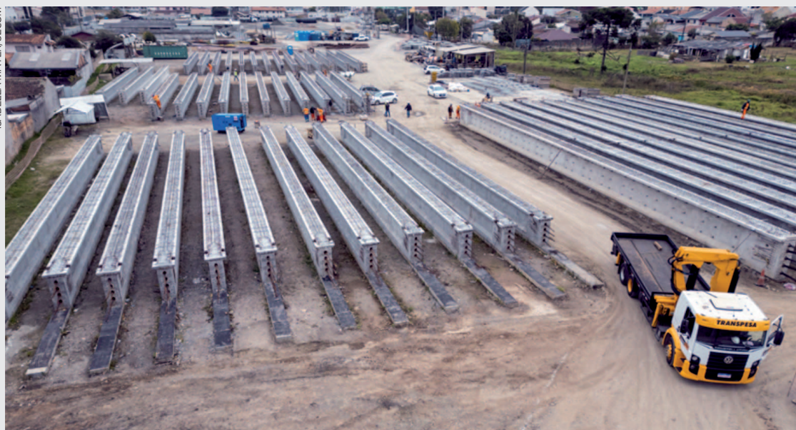
A operação teve início nesta segunda-feira apenas com bloqueios parciais para preparação da área de trabalho

A alteração ocorreu devido a ajustes no cronograma de posicionamento dos equipamentos que serão utilizados na operação, entre eles o guindaste de grande porte responsável pelo içamento das estruturas. A operação teve início nesta segunda-feira apenas com bloqueios parciais para preparação da área de trabalho. A operação de lançamento das vigas tem duração estimada de 15 dias e é uma das etapas mais complexas da construção do novo viaduto.