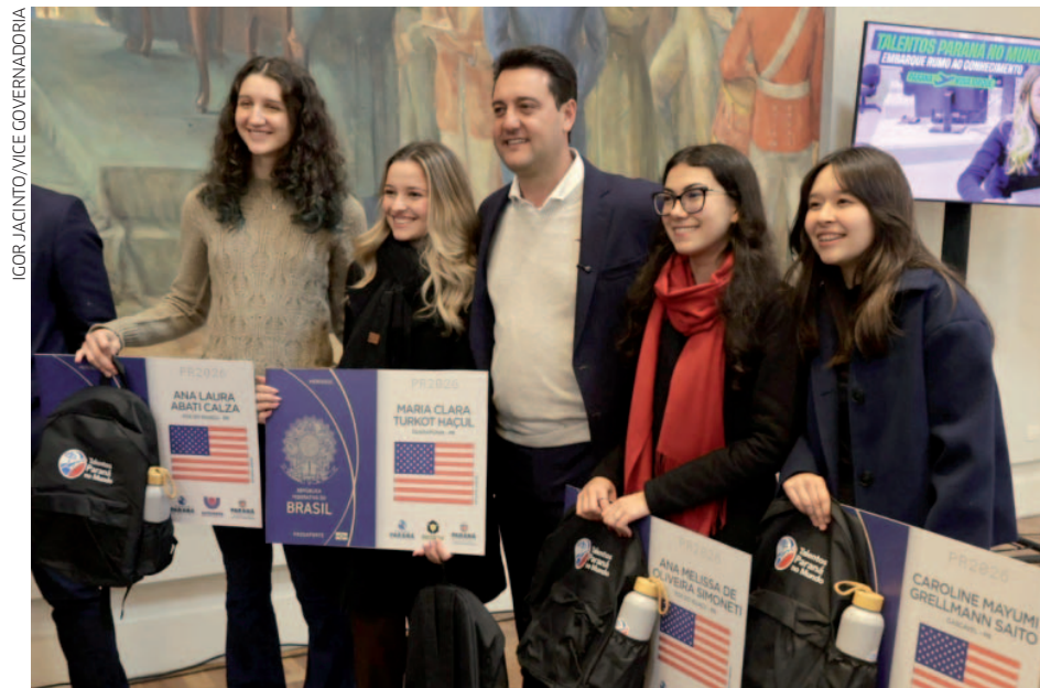
Eles vão estudar na Universidade da Cidade de Nova York (CUNY), instituição que possui entre os ex-alunos e pesquisadores 13 laureados com o Prêmio Nobel

Para Ratinho Junior, a experiência internacional permitirá que os estudantes tragam novos conhecimentos