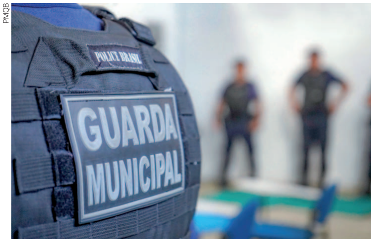
Conforme os dados divulgados, a corporação efetuou 2.650 atendimentos ao longo dos meses de janeiro, fevereiro e março

Ao todo, foram 512 atendimentos a ocorrências; 120 abordagens a suspeitos em veículos, motociclistas ou transeuntes; 1.648 pontos base estratégicos,