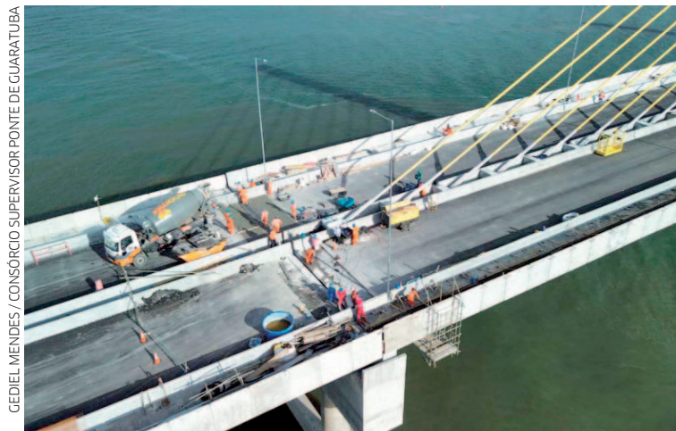
A pavimentação do lado de Guaratuba começou no fim de março e já está perto da conclusão

C omeçou nesta semana a instalação de pavimento asfáltico e canaletas de drenagem no acesso de Matinhos dentro das obras da Ponte de Guaratuba, que envolvem as pistas principais, o acesso a Cabaraquara, a pista que vai passar embaixo do início da ponte e o retorno em nível. A pavimentação do lado de Guaratuba começou no fim de março e já está perto da conclusão, restando apenas etapas de iluminação, finalização do trecho de Caieras e acabamento geral. Outra novi-