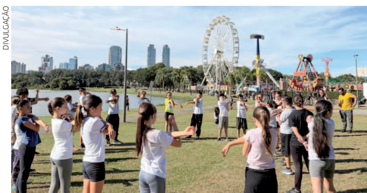
O evento é inclusivo, permitindo a participação de crianças de todas as idades, inclusive com deficiência, sempre em um ambiente seguro e acolhedor

O município integra o circuito desde 2015, quando a Escola