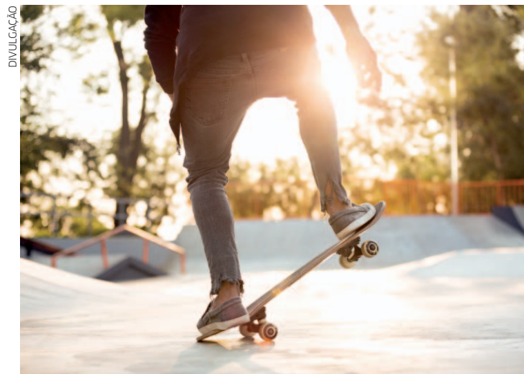
As inscrições seguem abertas até 23 de abril, online ou no Centro da Juventude

As atividades acontecem em dois períodos: das 9h às