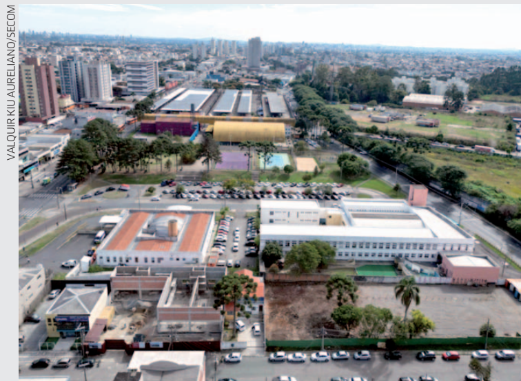
A escola atende cerca de 320 alunos, muitos com deficiências físicas, que dependem de estrutura adequada para chegar com segurança às atividades escolares

Boa parte dos estudantes são atendidos pelo Sistema Integrado de Transporte para Educação Especial (Sites), serviço essen-