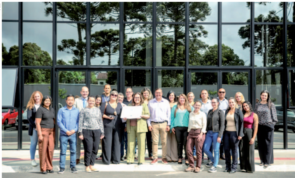
Localizado no Centro de Pinhais, com uma área de 3.100 metros quadrados e mais de 300 m 2 de área construída, o imóvel será completamente revitalizado para atender o público

Localizado no Centro de Pinhais, com uma área de 3.100 metros quadrados e mais de 300 m 2 de área construída, o imóvel será completamente revitalizado para atender o público das 8h às 17h. A Secretaria Municipal de Assistência Social (Semas) irá compor uma nova equipe para atuar no local, oferecendo acolhimento e uma série de serviços às pessoas idosas e famílias em vulnerabilidade social, promovendo maior qualidade de vida no cuidado a esse público. A ação também está inserida no contexto da