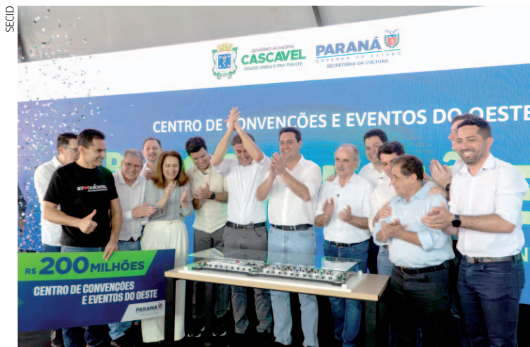
Neste momento, são mais de R$ 4,2 bilhões empenhados em obras, equipamentos e investimentos pela secretaria

Esses investimentos, que estão dentro do maior ciclo de recursos disponibilizados para os municípios, têm impacto direto na qualidade de vida, o que pode ser comprovado pelo Índice de Gini e Índice Ipardes de Desempenho Municipal (IPDM), que apontam para um progresso