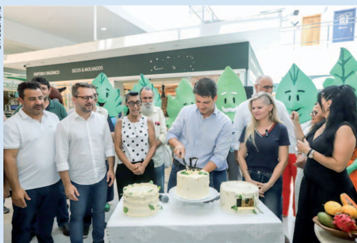
O prefeito Eduardo Pimentel participou do evento e parabenizou a dedicação dos permissionários, que acordam cedo todos os dias para ofertar produtos orgânicos fresquinhos ao público curitibano

O prefeito Eduardo Pimentel participou do evento e parabenizou a dedicação dos permissionários, que acordam cedo todos os dias para ofertar produtos orgânicos fresquinhos ao público curitibano. Ele também anunciou a liberação