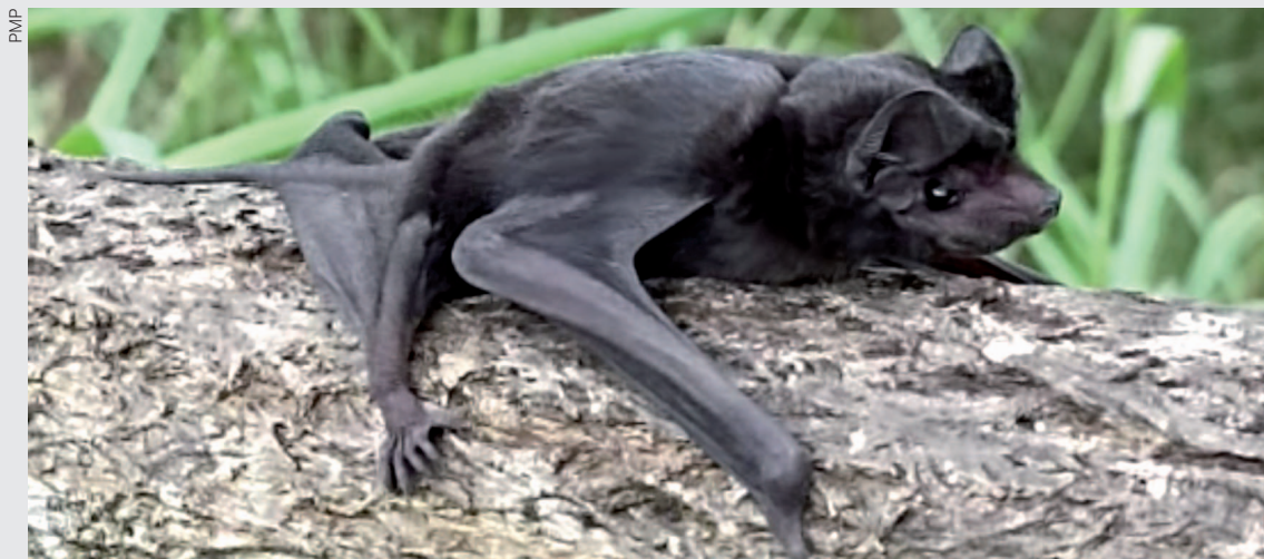
"Se encontrar um morcego caído no chão ou se o animal adentrar sua residência, a regra é nunca tocar nele sem proteção"

"Se encontrar um morcego caído no chão ou se o animal adentrar sua residência, a regra é nunca tocar nele sem proteção. Mesmo que pareça morto