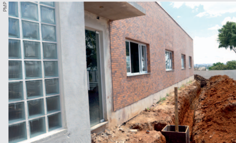
As equipes da empresa contratada por licitação também instalam as portas e janelas e concluem os muros

As obras do novo Centro de Referência da Assistência Social (Cras) Norte seguem em ritmo acelerado. No momento, as equipes executam serviços de cisterna, finalizam a escavação da parte externa da edificação - que compreende estacionamento, calçada e drenagem - e aplicam piso em granitina nas áreas internas. As equipes da empresa contratada por licitação também instalam as