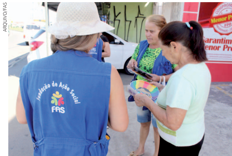
Neste fim de semana, mais equipes estarão nos desfiles dos blocos e escolas de samba e no baile infantil, na região central da cidade

Durante as ações educativas, as equipes distribuirão material gráfico da campanha Vamos Dizer NÃO ao Trabalho Infantil, que tem como símbolo o catavento de cinco pontas, ícone internacional da