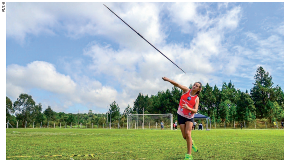
O programa oferece 16 modalidades esportivas gratuitamente à população, contemplando públicos de todas as idades

O programa oferece 16 modalidades esportivas gratuitamente à população, contemplando públicos de todas as idades. Entre elas estão atletismo, ballet infantil, capoeira, cross training, crossfut, futsal feminino, futsal masculino, futebol, ginástica, hidroginástica, jiu-jitsu, judô, karatê, pilates, ritmos e tênis. Todas as