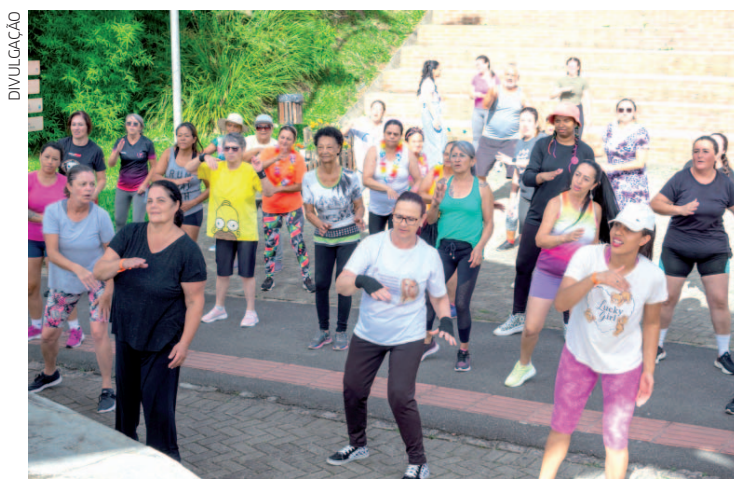
A atividade reuniu cerca de 75 participante

grantes das Oficinas do Poliesportivo e do Centro da Juventude, alunos das turmas de ginástica, além de pessoas que estavam passando pelo parque e aproveitaram para entrar no ritmo. Com muita música, energia e clima de folia, o aulão transformou a manhã em um momento de integração, saúde e diversão para todas as idades. A ação contou também com a participação da Secretaria da Mulher, que realizou a distribuição das pulseirinhas da campanha "Não é Não", reforçando, neste período de Carnaval, a conscientização e o combate ao assédio sexual.