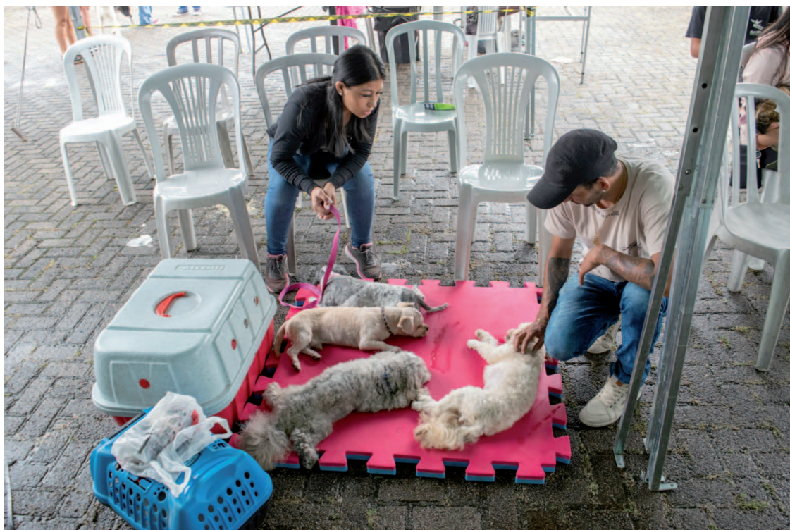
A ação aconteceu no Centro da Juventude e beneficiou 859 animais, sendo 509 cães e 350 gatos

Piraquara recebeu o Programa Castra + Paraná, uma parceria da Prefeitura de Piraquara, por meio da Secretaria de Meio Ambiente, com o Projeto do Deputado Federal Matheus Laiola que realizou um mutirão de castrações gratuitas de cães e gatos.