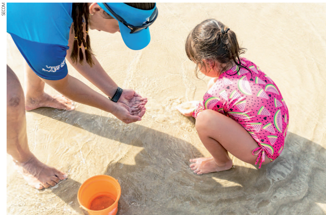
Os boletins de balneabilidade são disponibilizados durante a temporada de verão, período em que há maior fluxo de usuários nos locais monitorados

De acordo com o relatório ampliado do Verão Maior Paraná, dos 66 locais analisados pelo Instituto Água e Terra (IAT) no Litoral, Costa Oeste - onde estão os balneários do Lago de Itaipu - e no Rio Parapanema, no Norte, apenas 11 não são recomendados para banho, ou seja, 83% têm boa qualidade da água. As informações constam no 5º Boletim de Balneabilidade do IAT, referentes à semana de 16 a 22 de janeiro. O IAT orienta que os banhistas observem sempre a si-