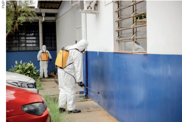
A borrifação é feita regularmente pelos agentes de combate a endemias e tem efeito residual, que pode durar até quatro meses no ambiente

O trabalho com inseticida faz parte das novas tecnologias preconizadas pela atual diretriz nacional, determinada pelo Ministério da Saúde. Com grande circulação de pesso-