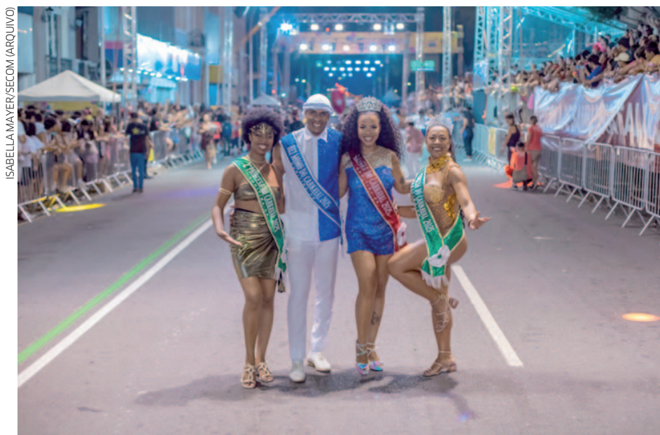
A escolha e nomeação dos ganhadores acontece no dia 27 de janeiro, no Memorial de Curitiba, às 20h

A escolha e nomeação dos ganhadores acontece no dia 27 de janeiro, no Memorial de Curitiba, às 20h. Os candidatos aos títulos de Rei Momo, Rainha do Carnaval, Primeira e Segunda Princesa participarão de um desfile com fantasias temáticas e serão avaliados nos seguintes critérios: Samba no pé, Simpatia e Desenvoltura. O candidato primeiro colocado será coroado como Rei Momo e a primeira can-