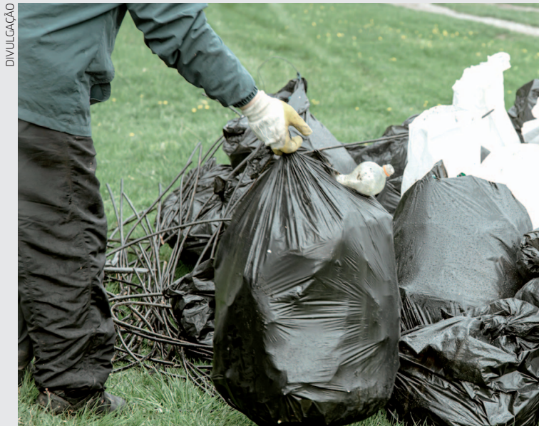
A coleta seguirá um cronograma definido pelo órgão responsável e será realizada no prazo de até 30 dias após o protocolo do requerimento

De acordo com a nova regulamentação, a retirada dos resíduos será gratuita ao proprietário de imóvel integrante de CadÚnico conforme critérios de renda. A Prefeitura realizará a coleta de até 1 metro cúbico (1 m³) de entulho por mês, o que equivale a 20 car-