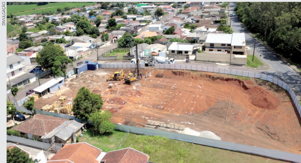
A unidade está sendo construída em um terreno de 2.946,27 m², garantindo melhor acesso à população da região

O investimento amplia e qualifica o atendimento em saúde, beneficiando diretamente os moradores da Vila Macedo e da Vila Militar, com um espaço planejado para oferecer mais conforto, eficiência e cuidado humanizado. Com mais de 900 m² de área construída, a nova UBS contará com 9 consultórios