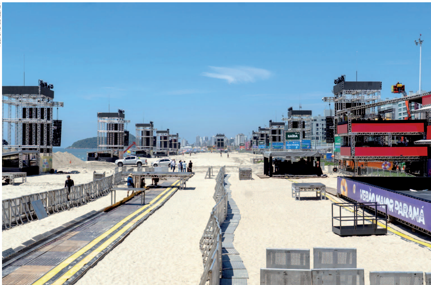
Barreiras também foram instaladas para delimitar a circulação segura do público, enquanto policiais militares já atuam na região para orientar a população

A erosão registrada nos últimos dias foi causada por uma ressaca do mar, fenômeno natural, cíclico e esperado no Litoral, que se estendeu até São Paulo. Esse tipo de evento costuma provocar o