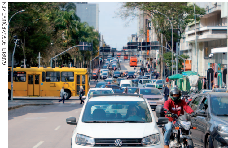
O avanço coincide com a sanção da lei pelo governador Carlos Massa Ratinho Junior, que reduziu a alíquota do IPVA de 3,5% para 1,9% do valor venal de automóveis, motocicletas e caminhonetes

Além do aumento nos primeiros emplacamentos, os dados mensais indicam outro