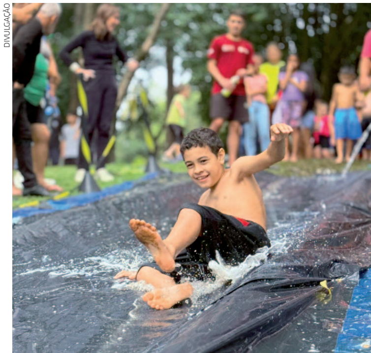
Entre as atrações confirmadas estão piscina de bolinhas, cama elástica, tobogãs infláveis, toboágua de lona, brincadeiras recreativas e gincanas com água

Entre as atrações confirmadas estão piscina de bolinhas, cama elástica, tobogãs infláveis, toboágua de lona, brincadeiras recreativas e gincanas com água, além de brinquedos adaptados que reforçam o caráter inclusivo da ação.