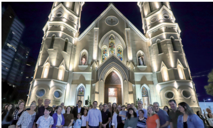
Inauguração da iluminação cênica da Igreja Bom Jesus do Cabral, valorizando o patrimônio histórico da cidade