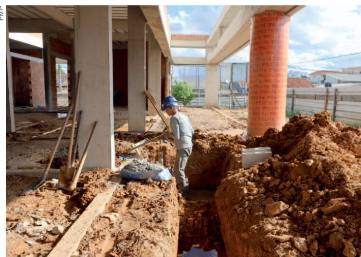
As equipes executam serviços de alvenaria, desforma das lajes e infraestrutura externa, que compreende abertura de valas para rede hidráulica

Além da ampliação das equipes de atendimento, a unidade terá climatização em todos os ambientes, com sistema fotovoltaico de energia (que utiliza placas solares). Depois de pronta, a estrutura de aproximadamente 1.000 metros quadrados contará com seis consultórios, sendo dois para a especialidade de ginecologia; sala de acolhimento e pré-consulta; sala de vacinação; sala de nebulização; sala de aleitamento; farmácia, auditório, três con-