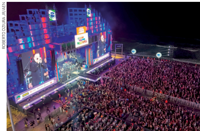
Show de Fábio Jr

Com Ana Castela, Paralamas do Sucesso, Inner Circle, Fernandinho, Murilo Huff, Léo & Raphael, Gian & Giovanni e Diego & Arnaldo no próximo final de semana, de 29 a 31 de janeiro, os números de 2025 serão superados com folga. Foram necessários apenas três finais de semana, nove dias e 24 shows para igualar a marca recorde de público de 2025. Restam ainda mais duas semanas de atrações, inclusive internacional, para lotar as areias do Litoral do Paraná. Na comparação com 2025, que já detinha números expressivos, os 1,82 milhão foram distribuídos em sete finais de semana, 17 dias e 33 atrações. Com três grandes shows neste final de semana, o empate com 2025 veio de Gustavo Lima, que reuniu 265 mil pessoas neste domingo, o segundo maior da história do festival. Com músicas entre as mais tocadas por mais de uma década, o "embai-