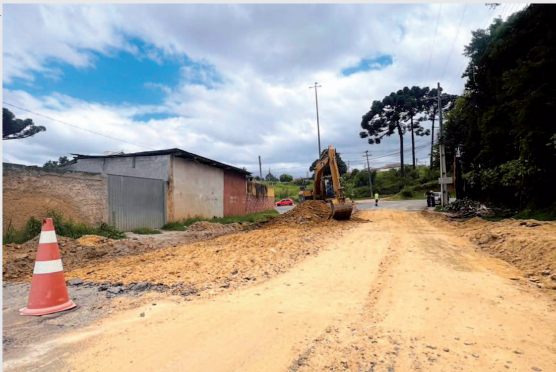
A requalificação da Avenida Manoel Muller de Siqueira representa mais um avanço na modernização da malha viária de Rio Branco do Sul

clusão dos trabalhos é de 120 dias, podendo variar conforme as condições climáticas e o andamento das etapas previstas no cronograma técnico. Durante a execução da obra, a Prefeitura orienta que motoristas e moradores redobrem a atenção ao transitar pelo local, respeitando a sinalização e eventuais alterações no fluxo de veículos. A requalificação da Avenida Manoel Muller de Siqueira representa mais um avanço na modernização da malha viária de Rio Branco do Sul, contribuindo para a melhoria da qualidade de vida da população e para o fortalecimento da mobilidade urbana.