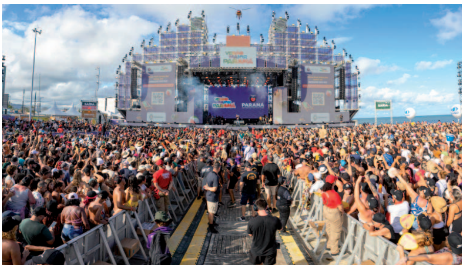
Show de Gustavo Lima