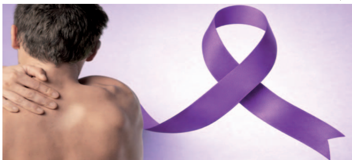
Apesar de ter tratamento e cura disponíveis gratuitamente pelo Sistema Único de Saúde (SUS), o diagnóstico tardio ainda representa um desafio