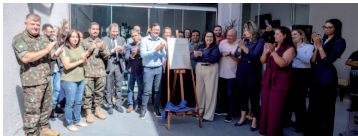
Antes mesmo da inauguração oficial, o PAS já se mostra um grande sucesso, tendo otimizado o atendimento e gerando comodidade a mais de 1.300 munícipes