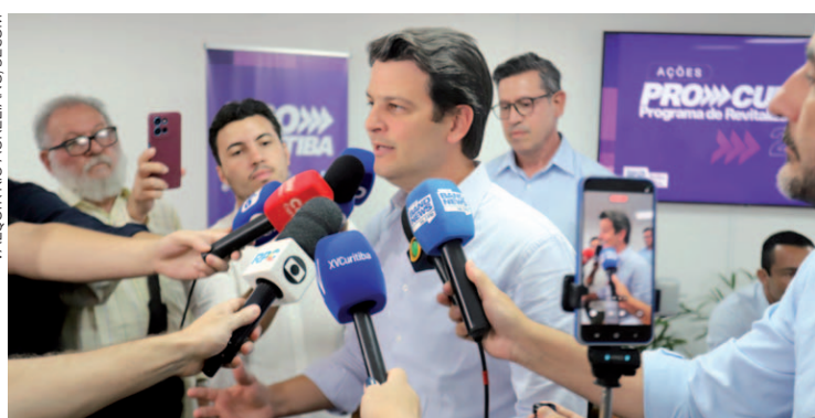
Prestação de contas das obras 2025 e apresentação do calendário pró Curitiba 2026

Também fazem parte do pacote obras de outras áreas, como