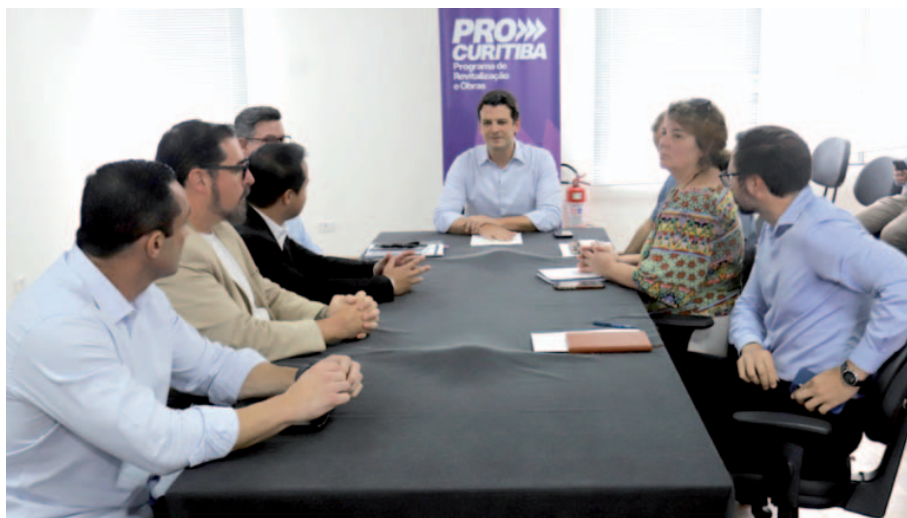
Prestação de contas das obras 2025 e apresentação do calendário pró Curitiba 2026