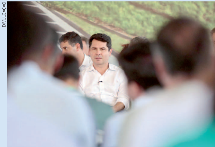
"O Paraná é o maior produtor brasileiro de tilápia e tem uma cadeia produtiva organizada, de alta qualidade, que envolve milhares de agricultores", avalia Curi

"O Paraná é o maior produtor brasileiro de tilápia e tem uma cadeia produtiva organizada, de alta qualidade, que envolve milhares de agricultores. Esse processo não pode ser prejudicado por peixe importado sem o mesmo nível de controle. Em outras palavras: quem