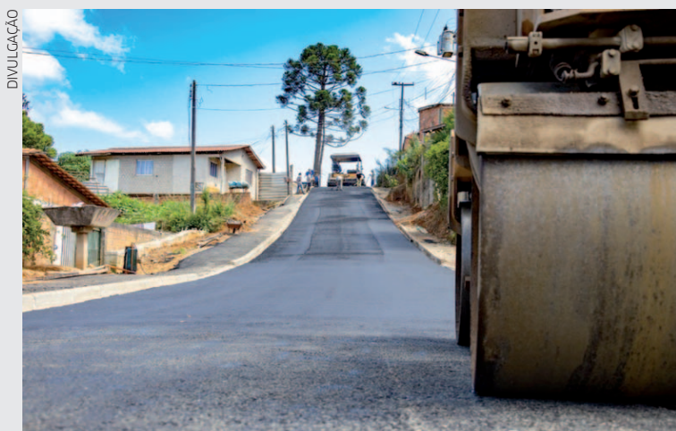
Ruas que ainda não receberam intervenção já contam com projeto concluído e recursos assegurados, garantindo continuidade e transparência ao processo

O plano não é apenas anunciado - ele está financiado, com obras em andamento e novas frentes sendo licitadas. Ruas que ainda não receberam intervenção já contam com projeto concluído e recursos assegurados, garantindo continuidade e transparência ao processo.