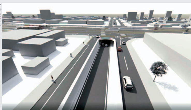
A construção das trincheiras da estação Vila São Pedro consta no plano de governo do prefeito Eduardo Pimentel

"Curitiba é uma cidade que tem a capacidade de tirar o planejamento do papel. Teremos homens na pista na obra das trincheiras da estação Vila São Pedro no próximo dia 2 de fevereiro e em seguida faremos a licitação do trinário da Marechal Floriano e da trincheira da Av. Pref. Lothário Meissner, no Jardim Botânico", afirmou o prefeito, referindo-se a três projetos executados pela Prefeitura de Curitiba em convênio com