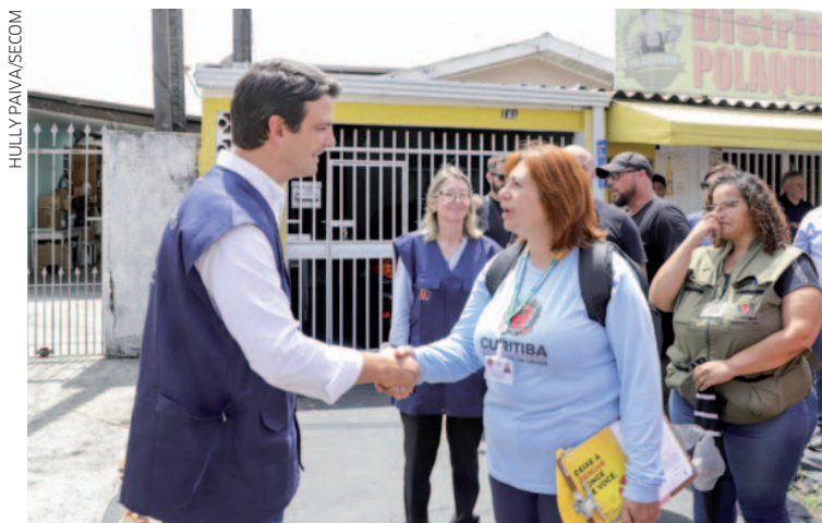
"Essa batalha contra o mosquito da dengue nós só vamos vencer se lutarmos em conjunto", disse o prefeito Eduardo Pimentel

A Prefeitura de Curitiba vai ampliar os mutirões da dengue em 2026. Estão previstos dois mutirões por semana nos bairros da capital, com projeção de realizar mais de 100 de janeiro a dezembro. Em 2025, as secretarias da Saúde e do Meio Ambiente realizaram 66 mutirões, com o recolhimento de 412 toneladas de resíduos. O prefeito Eduardo Pimentel lançou a campanha dos mutirões da dengue nesta quinta-feira (15) liderando as equipes da prefeitura no primeiro mutirão do ano, no bairro Sítio Cercado, onde convidou a população a trabalhar em conjunto com as equipes municipais. "Essa batalha contra o mosquito da dengue nós só vamos vencer se lutarmos em conjunto. A prefeitura lidera, orienta, mas a população precisa vir com força para nos ajudar na limpeza das suas casas, dos seus terrenos. E