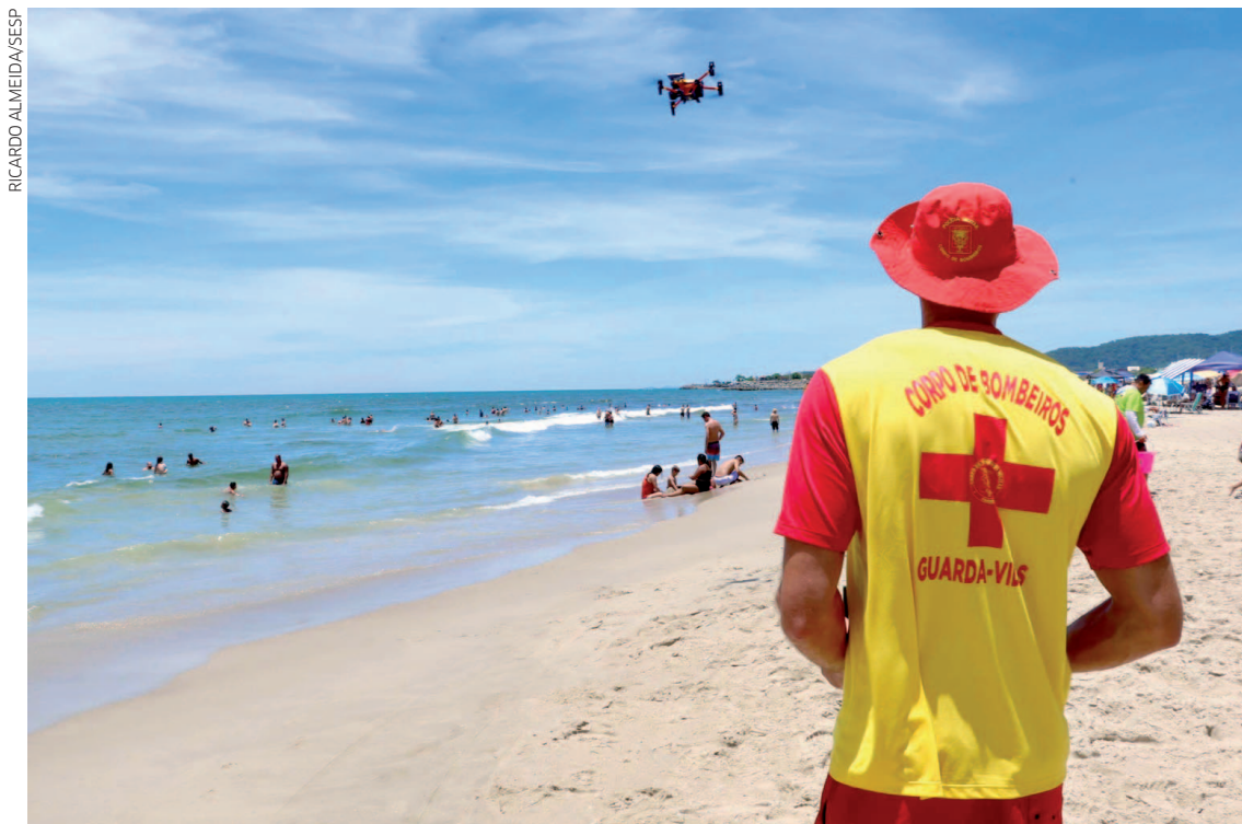
Drones são equipados com alto-falantes, câmeras térmicas, holofotes e sistemas com inteligência artificial

Atualmente, oito operadores de drones atuam diariamente apenas no Litoral do Estado, com apoio também nas praias de água doce das regiões Oeste e Noroeste do Paraná, onde há grande concentração de banhistas du-