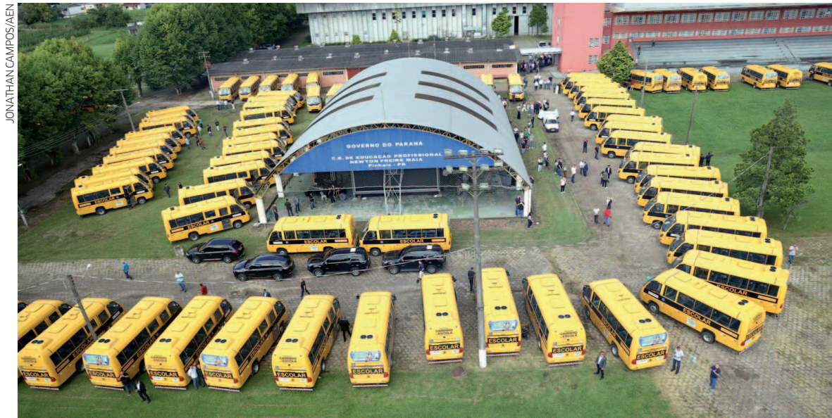
São os primeiros 113 ônibus novos, adaptados, com acessibilidade. Tudo para oferecer mais segurança e segurança para o aluno no trajeto de casa para a escola e vice-versa", falou o governador Ratinho Junior

O governador também lembrou outros investimentos feitos dentro do pacote da educação.