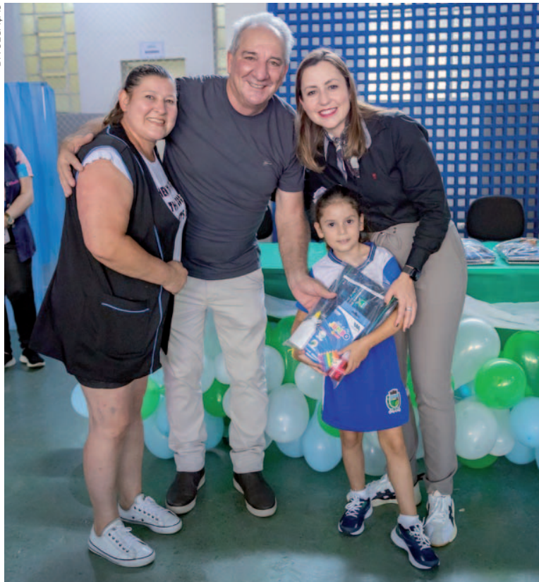
"Esse é um auxílio essencial para garantir que todas as crianças tenham as mesmas oportunidades na escola", afirmou a prefeita Karime Fayad

Para garantir que todos os alunos tenham os materiais necessários para um aprendizado de qualidade, a Prefeitura investiu mais de R$ 590 mil na aquisição dos kits, proporcionando mais igualdade entre os estudantes e aliviando o orçamento das famílias. "Esse é um