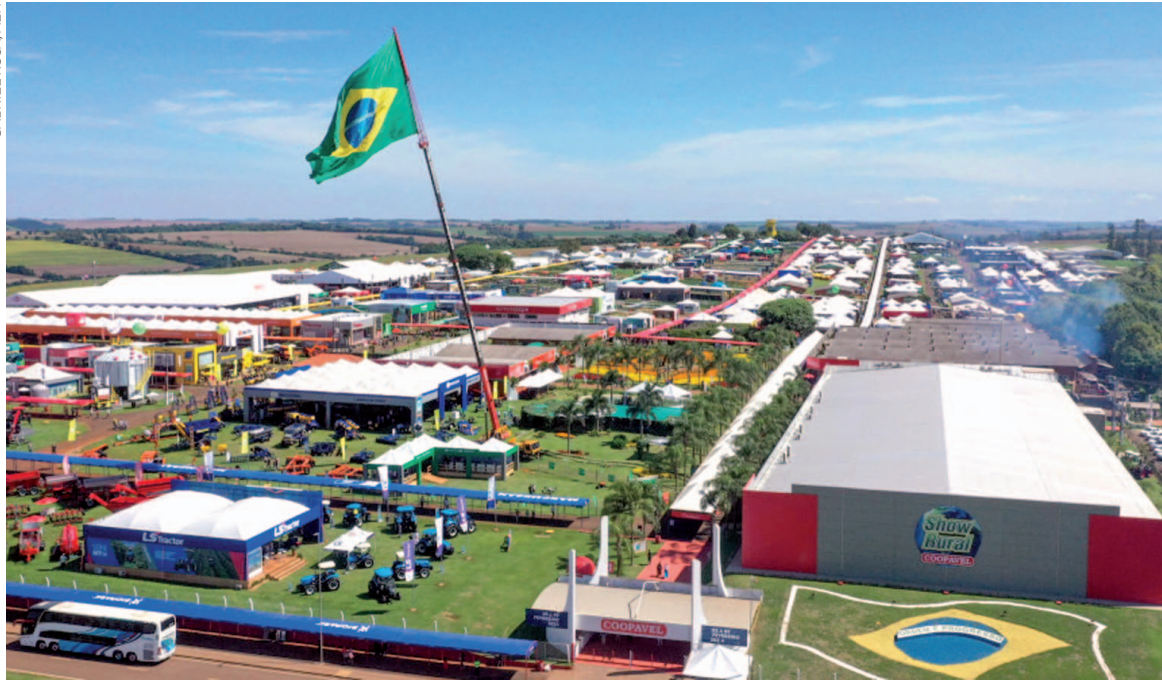
O presidente da Assembleia Legislativa do Paraná, deputado Alexandre Curi (PSD), destacou a grande expectativa com a interiorização do Poder Legislativo no Show Rural

Nesta 17ª edição do projeto, criado pela Mesa Executiva para aproximar o Parlamento da população, os deputados estaduais irão ouvir os anseios e reivindicações de entidades de classe e de membros da sociedade civil organizada. Durante as atividades, um documento com as demandas da região será entregue à Assembleia Legislativa. Além disso, os parlamentares vão homenagear per-