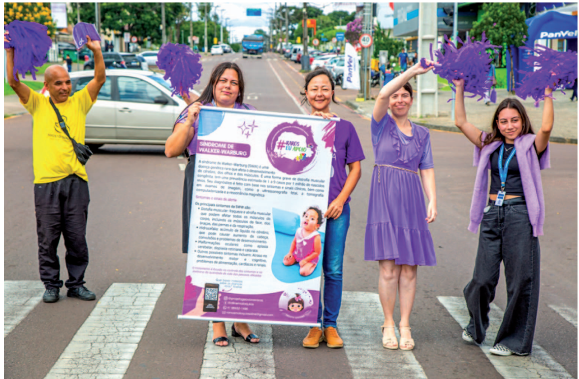
Profissionais da saúde, mães e defensores da causa das Doenças Raras se uniram para distribuir panfletos e proporcionar conversas informativas sobre o tema

A Blitz Informativa em prol da conscientização sobre a Campanha Fevereiro Lilás, que marca o início da movimentação, foi realizada na manhã desta quarta-feira, dia 05 de fevereiro, na Avenida Getúlio Vargas e abordou inúmeros carros e pedestres que passavam pelo local.