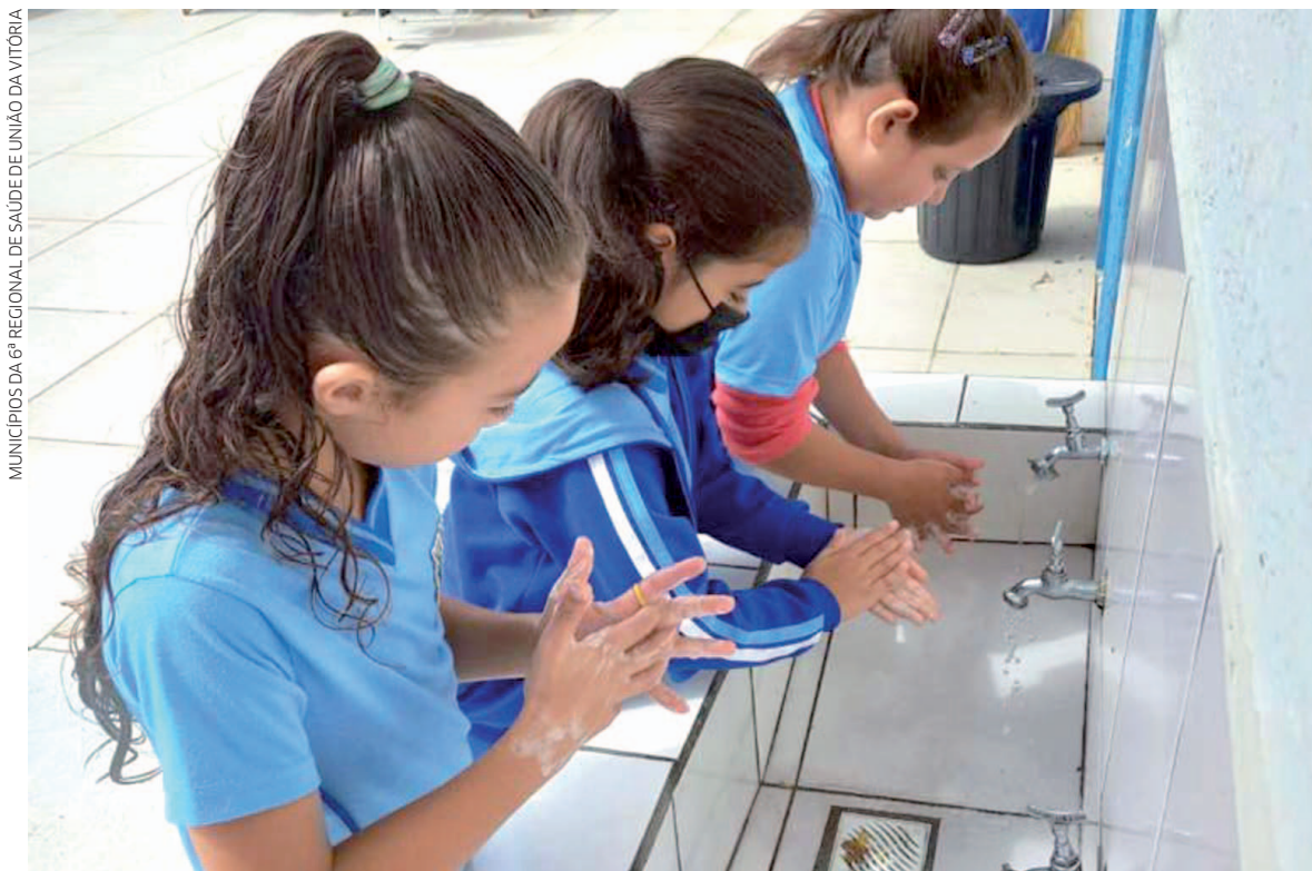
MUNICÍPIOS DA 6ª REGIONAL DE SAÚDE DE UNIÃO DA VITÓRIA

O Saúde na Escola é um programa federal, pautado em