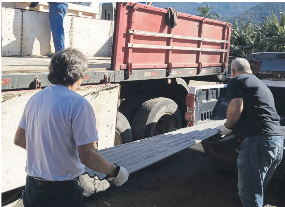
A semana foi marcada por diversos estragos causados por fortes rajadas de vento que atingiram o Paraná

Os ventos foram causados por um ciclone extratropical que provocou problemas em toda a região Sul. No Paraná, 27 municípios registraram