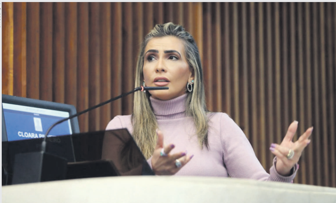
O objetivo da parlamentar é incentivar a prática do mototurismo que tem ampla relevância para a cultura do estado, além de homenagear os motociclistas paranaenses e aqueles que sob rodas visitam o Paraná