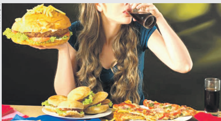
Confira os 4 maiores mitos e verdades sobre a perda ou o ganho de peso durante a estação

temperaturas, o corpo passa a necessitar de mais energia para gerar calor e manter a temperatura corporal adequada. Como nossa energia vem do que comemos e de nossas reservas de energia, o organismo manda sinais para aumentar a fome. No entanto, essa energia a mais que ingerimos é gasta na produção de calor. O problema é quando o consumo de alimentos ultrapassa a necessidade real do organismo.