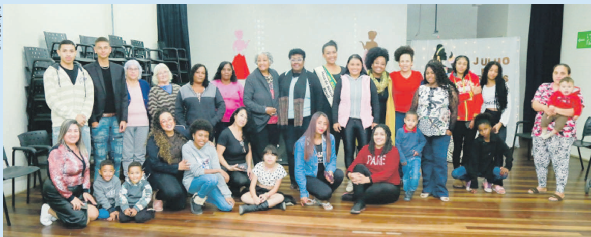
A ação é uma iniciativa criada em 2013, pela Odara - Instituto da Mulher Negra, em homenagem ao dia 25 de Julho

A Prefeitura de Piraquara, por meio da Secretaria de Cultura, Esporte e Lazer, realizou na Praça CEU, no Guarituba, o primeiro encontro, da 1ª edição, do Julho das Pretas no município. Na oportunidade, a Coordenadoria de Políticas de Promoção de Igualdade Racial de Piraquara lançou o "Projeto Empodera Pretas de Piraquara" com o tema "Visibilidade e Respeito". O Julho das Pretas, é o mês em que são promovidas ações que discutem a realidade das mulheres negras no Brasil e quais políticas afirmativas e de reparação histórica devem surgir ou defender para os próximos passos.