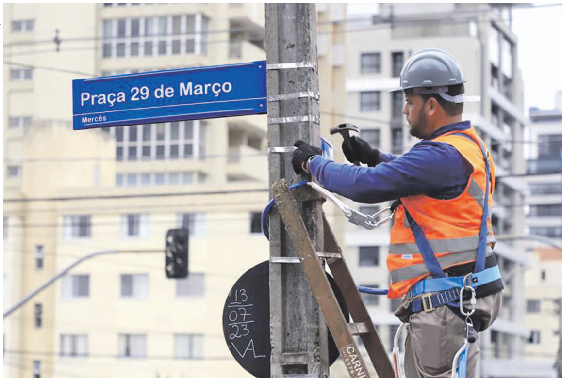
É a primeira renovação do sistema de identificação de vias de Curitiba em 26 anos

"A renovação das placas de Curitiba faz parte da urbanidade. Toda cidade civilizada tem nomes de ruas visíveis. Estamos substituindo a sinalização de nomenclatura de ruas por placas refletivas. A ideia é que as nove mil ruas de Curitiba tenham nome, números e sejam identificadas facilmente pelos correios e pelas pessoas que circulam pelas vias de nossa cidade". É a primeira renovação