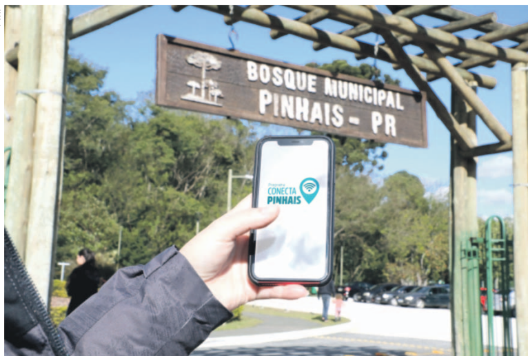
Com um investimento de aproximadamente R$ 3 milhões, o serviço já contempla 79 unidades da administração municipal, com 321 pontos instalados

Segundo a Secretaria Municipal de Administração (Semad), a solução não se restringe apenas ao atendimento do público externo, visa também a conexão de professores, alunos e pais de alunos nas mais de 40 unidades de ensino da rede municipal, com wi-fi na sala de aula. Com um investimento de aproximadamente R$ 3 milhões, o serviço já contempla 79 unidades da administração municipal, com 321 pontos instalados. Além das escolas, cmeis e unidades de saúde, incluindo a UPA e o Hospital Municipal, a internet pública está disponível no Parque das Águas, Bos-