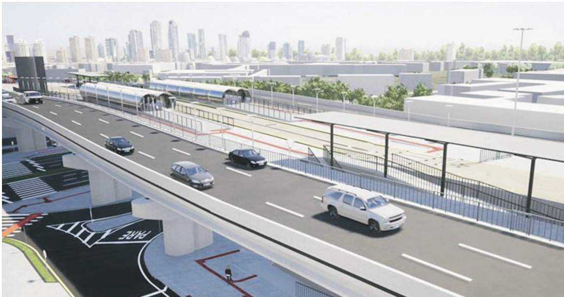
Viaduto do Tarumã ganha faixa exclusiva para o ônibus e duas estações de transporte