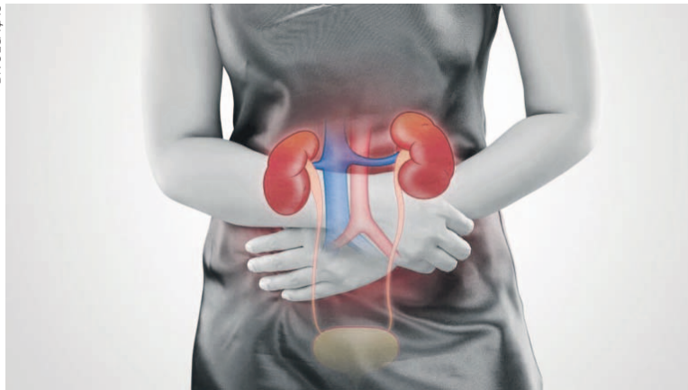
Pacientes masculinos apresentam mais chance de ter litíase renal, que é constatada com mais frequência em adultos com idade entre 20 a 40 anos