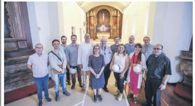
Prefeito Rafael Greca vistoria Museu de Arte Sacra (Masac) e a Igreja da Ordem Terceira de São Francisco de Chagas que estão passando por processo de restauração