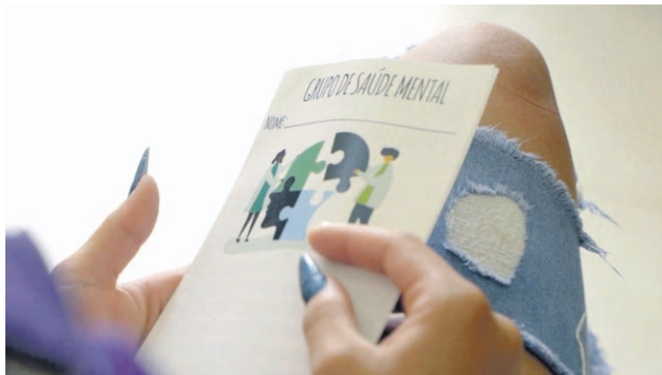
Janeiro Branco é um movimento social dedicado à construção de uma cultura da Saúde Mental na humanidade e também o nome do instituto que coordena esse movimento