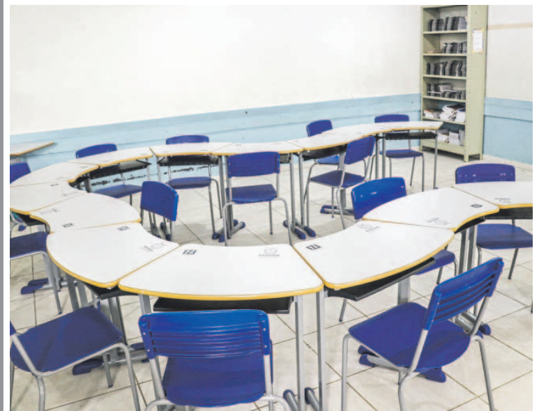
O investimento nas carteiras do novo modelo foi de R$ 10 milhões