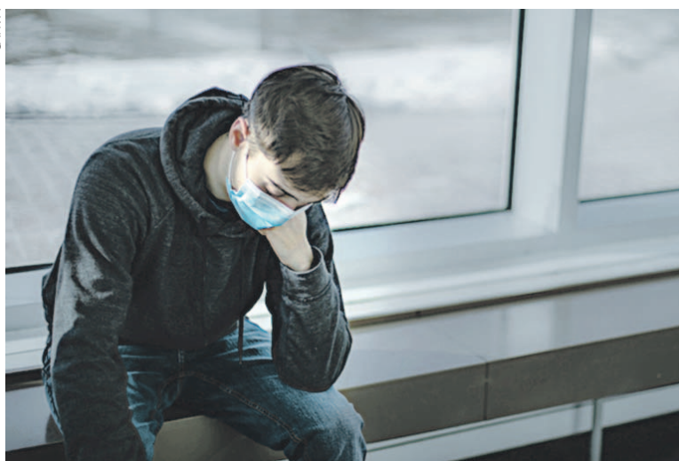
Centros de prevenção ao suicídio podem se tornar política pública em Curitiba