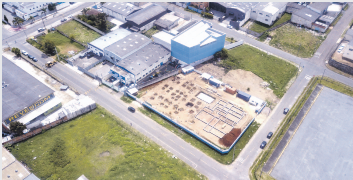
O novo Centro Municipal de Educação Infantil terá capacidade para atender até 248 alunos em educação integral

A edificação terá dois andares e infraestrutura para atender até 248 crianças, do berçário ao infantil. Serão 10 salas de aulas com espaços lúdicos, secretaria, salas dos professores, da pedagoga, diretoria, de recursos (Atendimento Educacional Especializado), cozinha, lavanderia, ba-