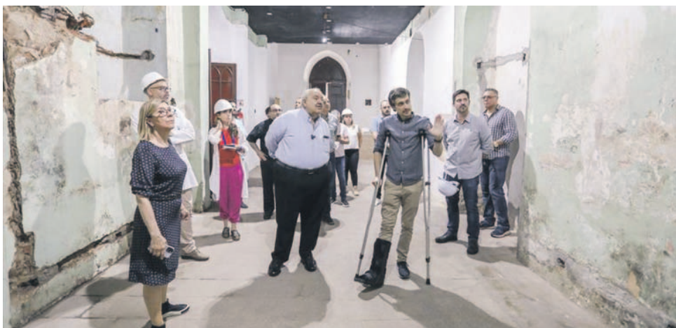
Prefeito Rafael Greca vistoria Museu de Arte Sacra (Masac) e a Igreja da Ordem Terceira de São Francisco de Chagas que estão passando por processo de restauração

P inturas históricas da época da visita do imperador Dom Pedro II à Curitiba foram descobertas no Museu de Arte Sacra (Masac), anexo à Igreja da Ordem Terceira de São Francisco de Chagas.