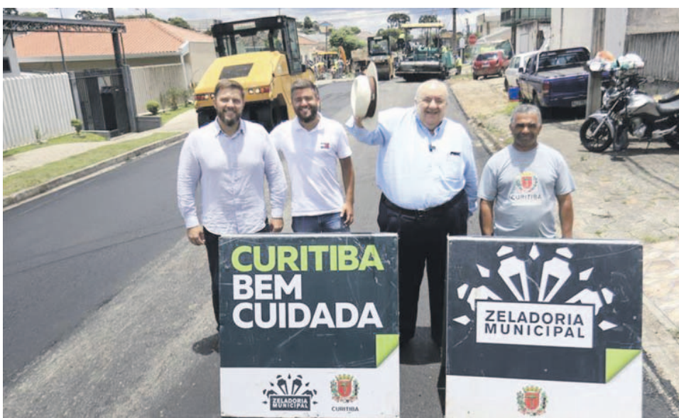
Prefeito Rafael Greca e o Secretário de Obras, Rodrigo Rodrigues, vistoriam obras de reciclagem de pavimento na rua Jaime Rodrigues da Rocha, no Capão Raso

o bairro. Iniciados no dia 25 de novembro, os serviços na Rua Jaime Rodrigues da Rocha têm previsão de conclusão até o fim desta semana.