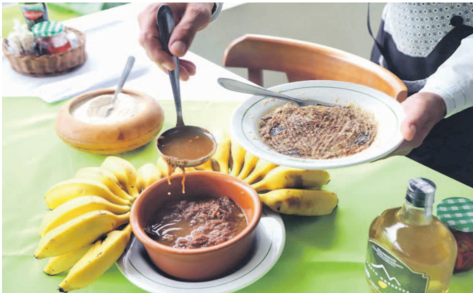
Terceiro estado com mais reconhecimentos de origem no Brasil, o Paraná possui agora 12 produtos com o registro de IG

naenses, o reconhecimento incentiva o turismo e a geração de renda das pessoas envolvidas nessa produção. "Ter um prato típico do nosso Litoral reconhecido nacionalmente com a Indicação Geográfica representa que a nossa história está sendo contada para quem ainda não a conhece. O barreado não é apenas um prato da culinária local. É uma cultura, uma tradição da comunidade que vive onde o Paraná começou a ser construído", diz. "A conquista da 12ª IG paranaense é resultado de um traba-