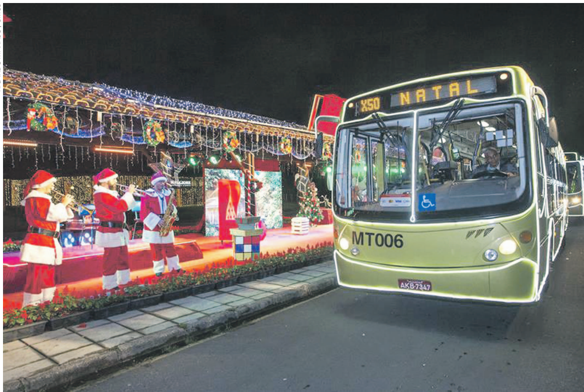
A Urbs (Urbanização de Curitiba S/A) disponibilizou linhas especiais para o público aproveitar os circuitos que passam por dentro dos parques

Para fazer o agendamento é preciso ter cadastro na plataforma E-Cidadão, procurar o evento no Guia Curitiba e selecionar o dia e horário. O participante rece-