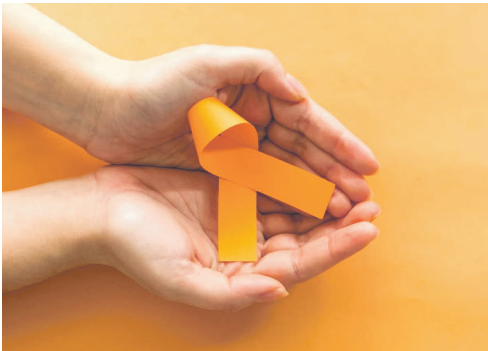
Mesmo com baixo índice de óbitos, o câncer de pele pode causar deformações no corpo para o resto da vida