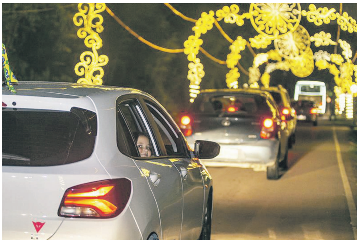
Neste lote extra serão disponibilizadas 300 vagas por dia (100 por sessão)