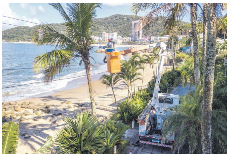
Além de um plano de investimentos na rede elétrica, as medidas incluem uma revisão geral da rede, reforço nos atendimentos e atividades na areia

Os investimentos foram destinados a sete municípios da região. Em Guaraqueçaba o montante foi de R$ 46 milhões. O município é