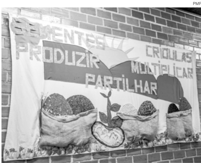
Evento será realizado em agosto em Pinhais, na RMC

Durante o inverno, tradicionalmente, acontecem festas celebrando as colheitas, a fartura da agricultura familiar, e são oportunidades para as famílias camponesas realizarem a troca de sementes e mudas entre si.