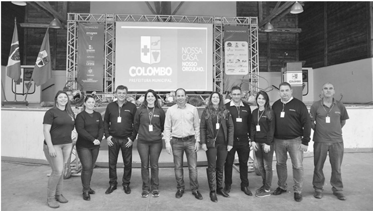
Evento foi realizado no Pavilhão de Eventos do Parque Municipal da Uva

O EVENTO CONTOU COM PALESTRAS DE DIVERSOS TÉCNICOS EXPERIENTES NO CULTIVO DE HORTALIÇAS - REUNINDO MAIS DE 200 PRODUTORES