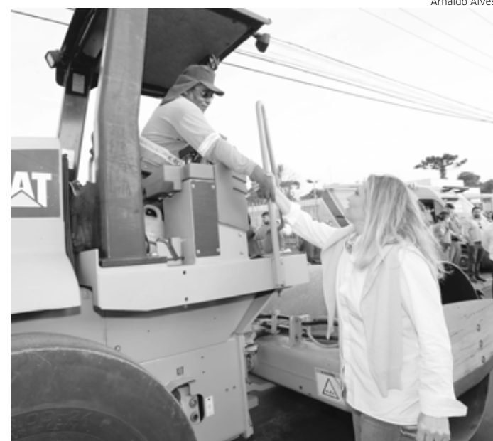
Governadora Cida Borghetti durante vistoria na rua José Rodrigues Pinheiro, na CIC

A governadora Cida Borghetti assinou nesta segunda-feira (2) a ordem de serviço para início de obras em 147 ruas de Curitiba. A autorização foi dada durante vistoria que a governadora e o prefeito Rafael Greca fizeram nas obras de pavimentação na rua José Rodrigues Pinheiro, na Cidade Industrial de Curitiba (CIC). Cida enfatizou que 265 ruas da capital serão revitalizadas até o fim do ano com recursos repassados à prefeitura pelo Governo do Estado, a fundo perdido. O investimento total soma R$ 120 milhões.