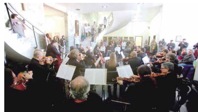
Camerata Antiqua se apresenta hoje às 10h30

A Camerata Antiqua de Curitiba faz, nesta terça-feira (3), às 10h30, um concerto gratuito na Santa Casa de Misericórdia. A apresentação faz parte do projeto “Música pela Vida” de difusão da música erudita e traz no repertório um apanhado histórico de compositores que marcaram sua geração, como Ola Gjeilo (1978), Antonio Vivaldi (1678-1741), Heitor Villa-Lobos (1887-1959), Eric Whitacre (1970) e Edmundo Villani-Côrtes (1930).