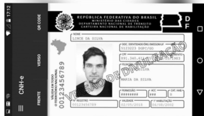
Emissão de CNH Digital passa a ser obrigatória no país

Passou a ser obrigatória nesta segunda-feira (2) a emissão da Carteira Nacional de Habilitação (CNH) Digital por todas as unidades da Federação, segundo o Conselho Nacional de Justiça (CNJ).