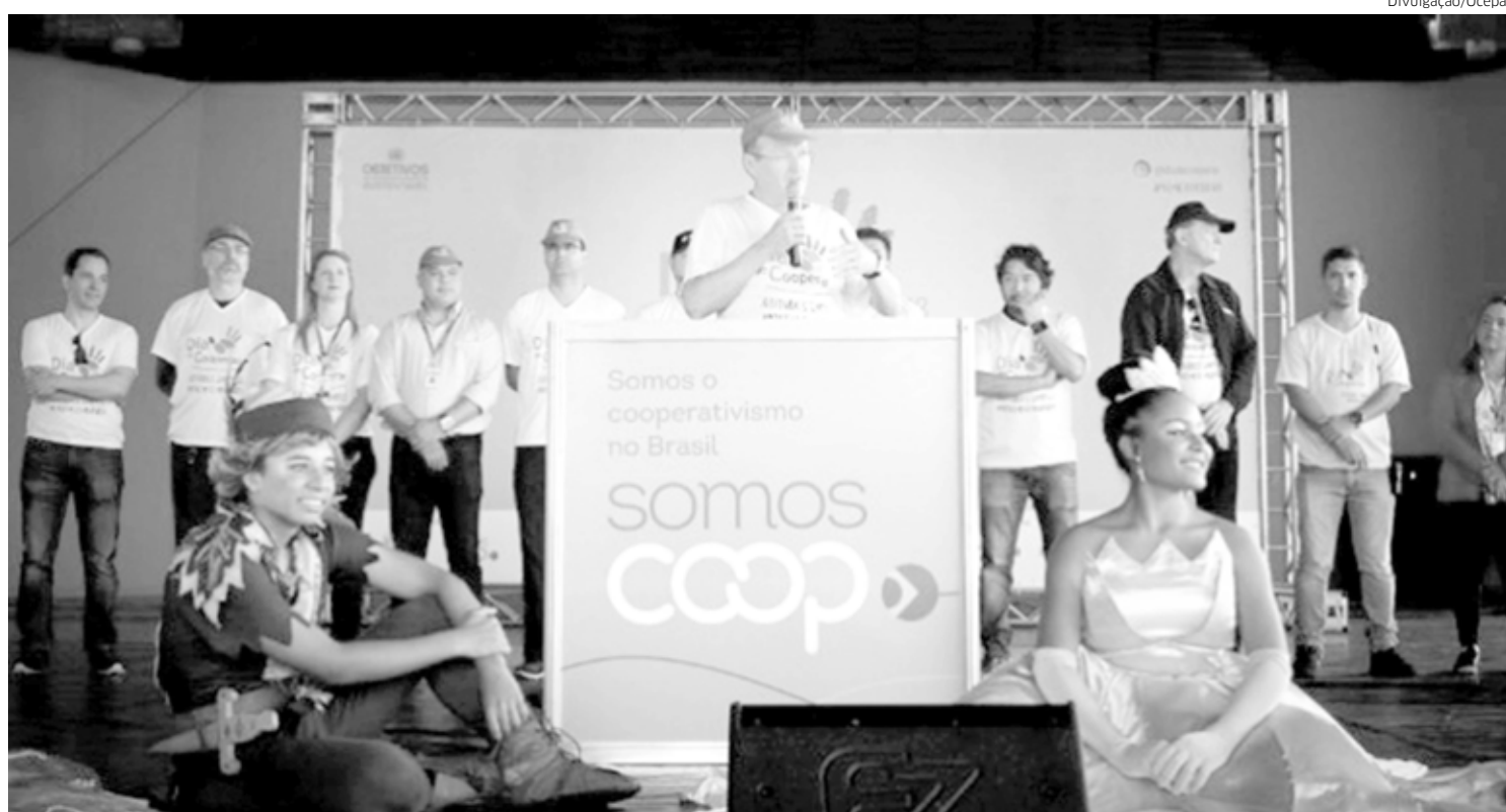
Objetivo é a adesão das cooperativas ligadas ao sistema Ocepar ao Programa Plante Árvores

A Secretaria de Estado do Meio Ambiente e Recursos Hídricos e o Instituto Ambiental do Paraná (IAP) firmaram um protocolo de intenções com a Organização das Cooperativas do Paraná (Ocepar) para incentivar a recuperação de áreas degradadas. A parceria visa a adesão das cooperativas ligadas ao sistema Ocepar ao Programa Plante Árvores, que promove a recuperação de áreas degradadas no Estado através de campanhas voltadas