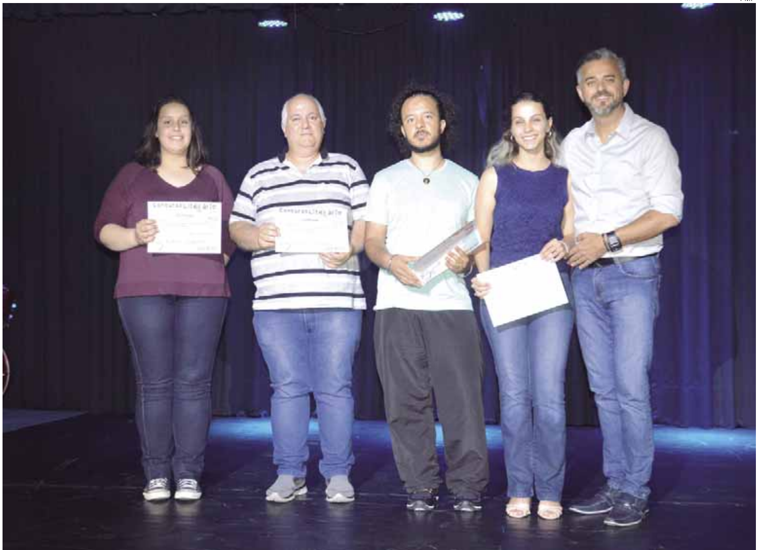
Premiados durante edição anterior do evento cultural de Pinhais

A INICIATIVA, DA BIBLIOTECA PÚBLICA DO MUNICÍPIO, TEM O INTUITO DE REVELAR TALENTOS NA ARTE DA ESCRITA, BEM COMO ESTIMULAR O HÁBITO PELA LEITURA