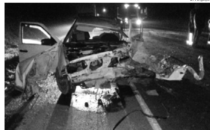
Acidente na BR-476 com vítima fatal na madrugada desta segunda-feira

Um acidente na BR-476, deixou três vítimas na Lapa, na Região Metropolitana de Curitiba, nesta madrugada de segunda-feira, 2.