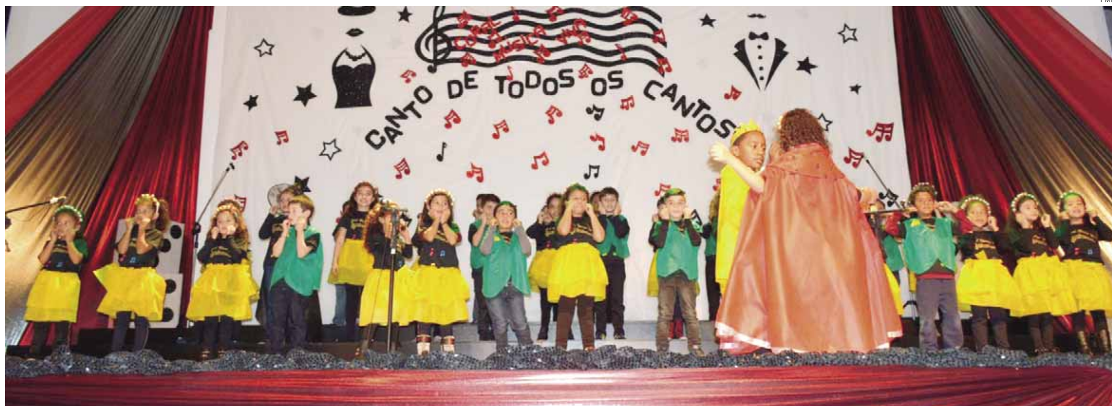
Apresentações aconteceram no Cenforpe, em Pinhais

OS ALUNOS FAZEM PARTE DO PROJETO “CORAL MÚSICA VIVA”, DESENVOLVIDO EM TODAS AS ESCOLAS DA REDE MUNICIPAL