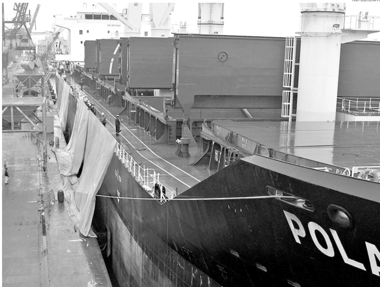
O relatório divulgado nesta semana considera os registros dos três últimos anos

ANUALMENTE, SÃO MOVIMENTADAS CERCA DE 2,2 MILHÕES DE TONELADAS DE CARGAS RECEBIDAS OU ENVIADAS DA/PARA A RÚSSIA PELO PORTO DE PARANAGUÁ – EM UM TRAJETO QUE DURA DE 20 A 23 DIAS. ISSO REPRESENTA A APROXIMADAMENTE 5% DE TUDO O QUE PASSA PELOS TERMINAIS PARANAENSES