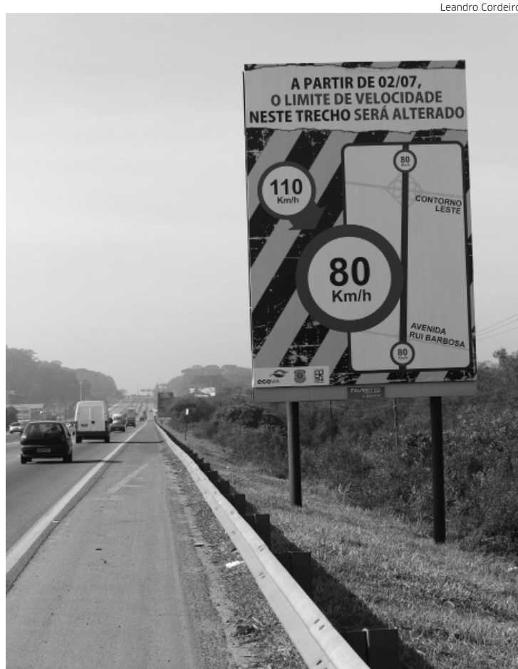
Ao dirigir acima da velocidade máxima permitida, o motorista pode ser autuado

“A redução do limite de velocidade entre os km 70 e 74 aumentará as condições de segurança no tráfego nesse trecho, mas pode pegar alguns motoristas de surpresa, especialmente os que trabalham na região e já estão acostumados com o atual limite de velocidade. Por isso, a alteração já está sendo informada por painéis, pela Imprensa e pelo Twitter da Ecovia, para que no dia da mudança todos os usuários já tenham sido comunicados de forma efetiva. Assim, todos po-