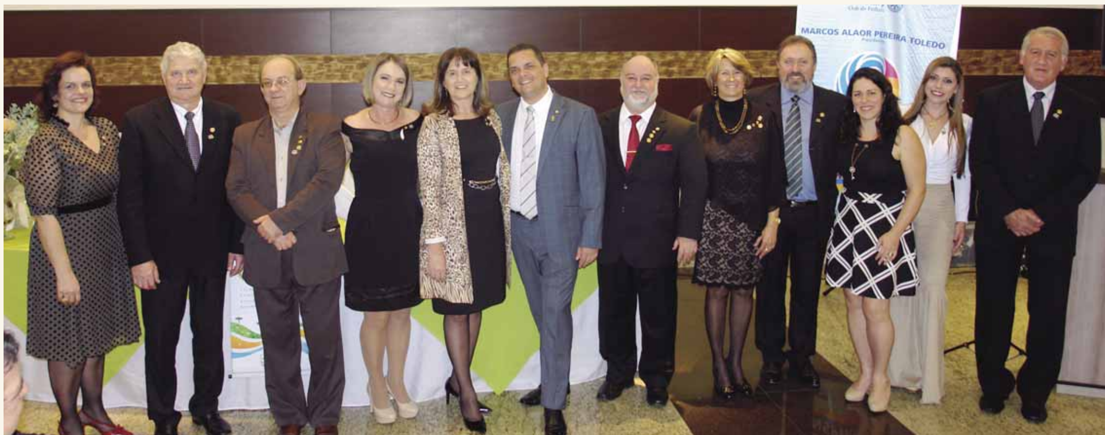
Os empossados da noite para o biênio 2018/2019